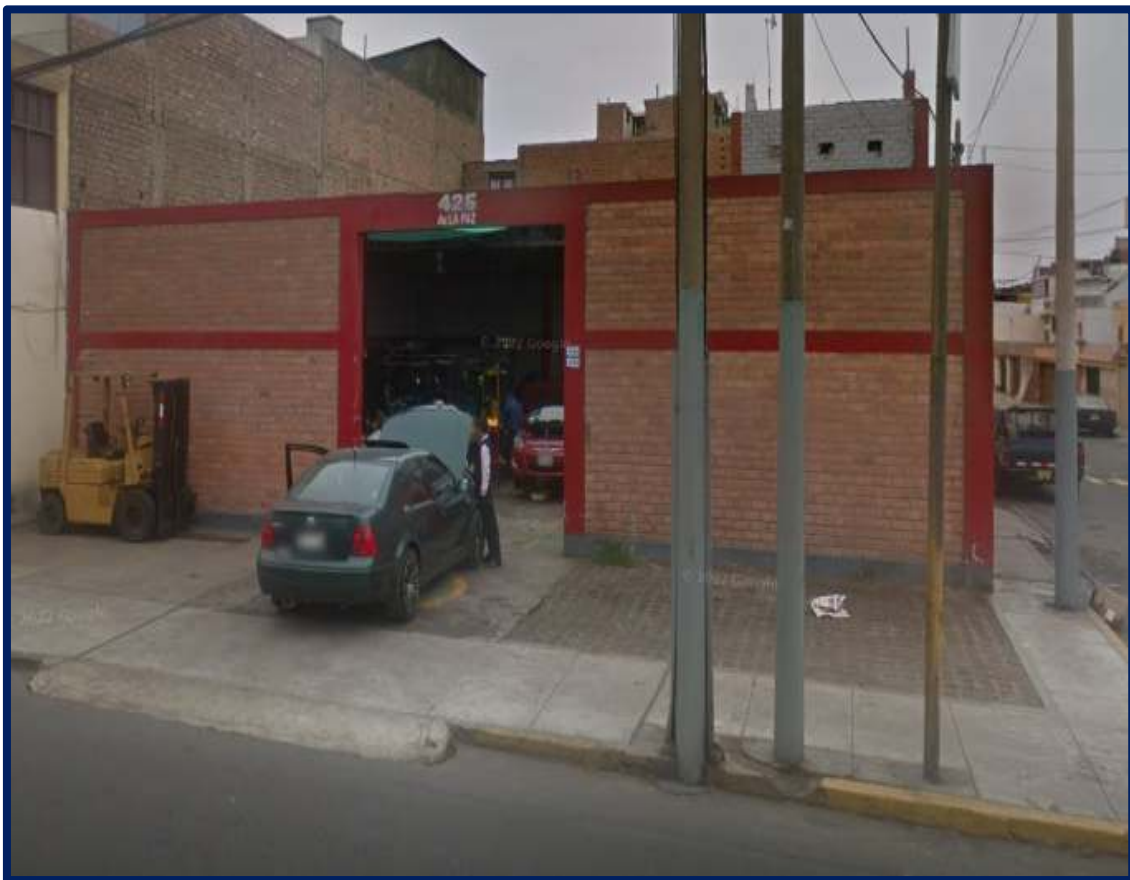
UBICACIÓN DE LAS INSTALACIONES DE MAT SERVICE LIFT TRUCK